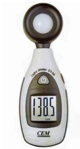
DT-86 標準価格(税込) ¥11,000.-