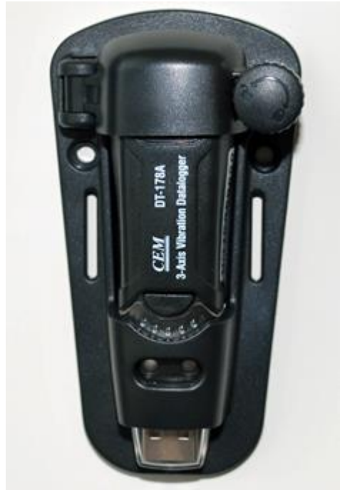
DT-178A と強カマグネット付き固定治具

DT-178A は振動の加速度ピークを 3 軸で測定できる振動/衝撃データロガーです。DT-178A では自由落下も同時に記録できるうえ、FFT (高速フーリエ変換) を使用したリアルタイムスペクトラル測定やリアルタイム測定にも対応しています。