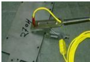
クリップ表面 温度センサ