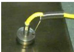
磁石表面 温度センサ