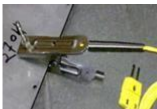
クリップ気体 温度センサ

特長: 断熱ボックスにより+850°Cまでの高温下で連続 80 分の使用に対応。同時に 4 ヶ所の温度測定がおこなえます。