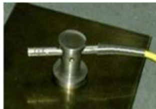
磁石気体 温度センサ