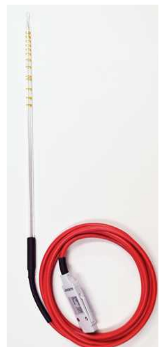
ガラス温度プローブ